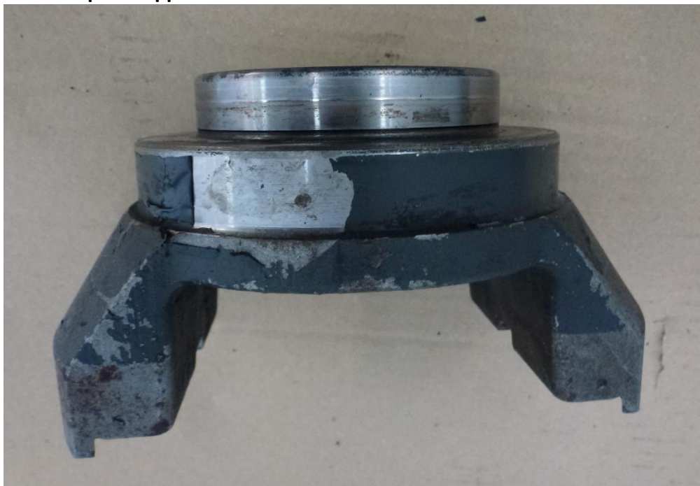
Рис. 12 Фланец выходного вала.