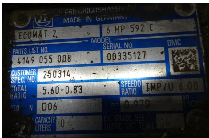
Рис.1 Идентификационная табличка АКПП сер. № 00335127

Дата начала разборки АКПП – 25.11.2019г. Разборку и дефектовку проводили механик: Ахтамов А.В.