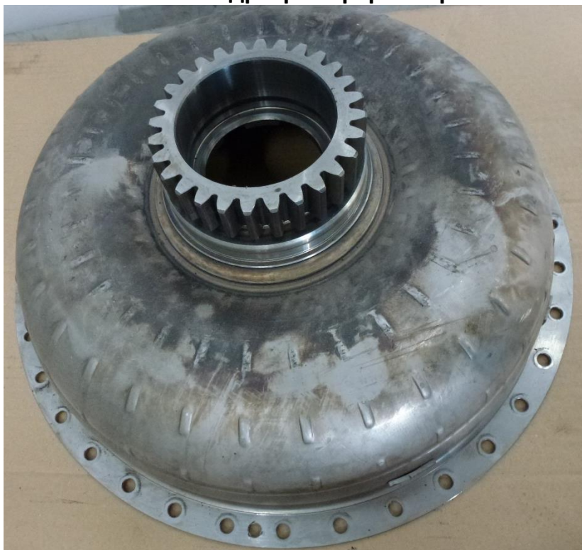
Рис. 10 Насосное колесо гидротрансформатора.