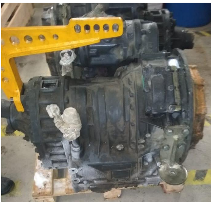
Рис.2 Вид сбоку.