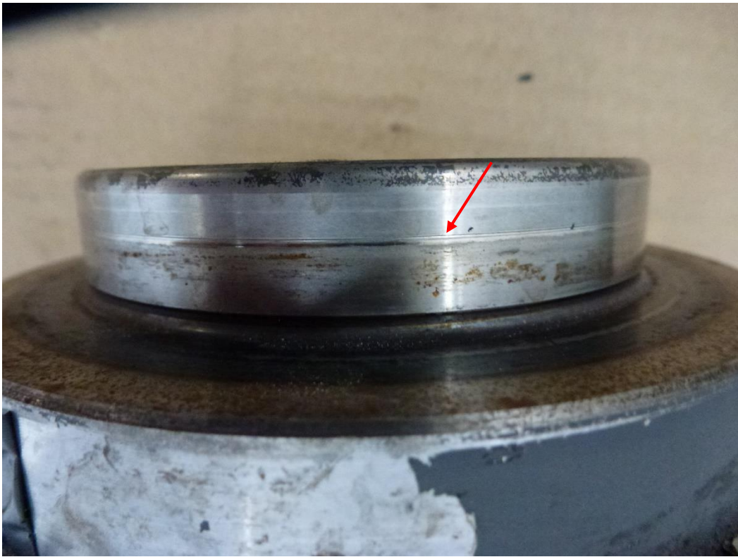
Рис. 13 Дефект: износ поверхности под уплотнительную манжету.