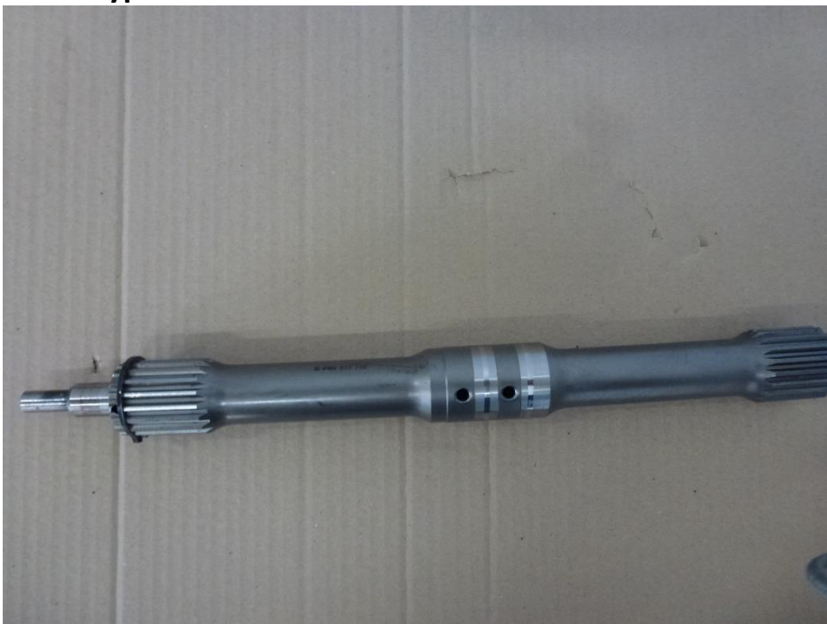
Рис. 7 Турбинный вал.