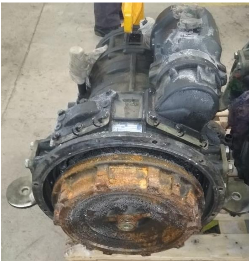
Рис.4 Вид со стороны ГТР.