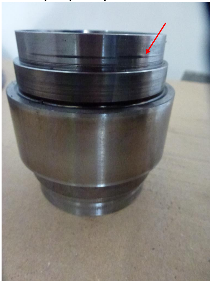
Рис. 9 Дефект: износ поверхности под подшипник