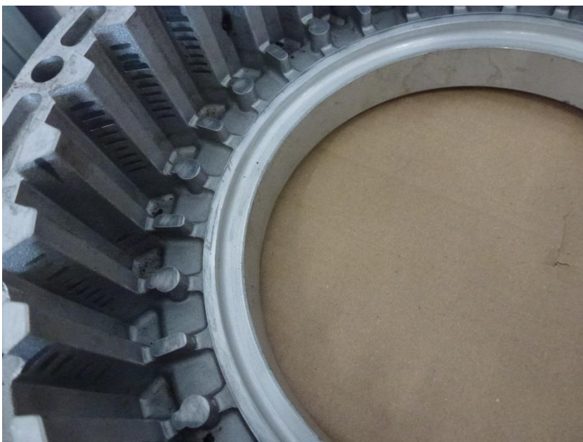
Рис.6 Износ ламелей пакета фрикционов G.

Пояснение: при данном дефекте происходит подклинивание стальных дисков при работе пакетов, и как следствие ударное переключение.