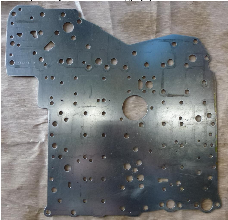
Рис. 14 Промежуточная плиты гидроуправления.