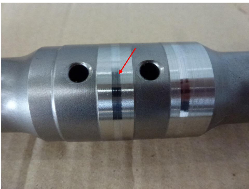
Рис. 8 Дефект: износ поверхности под уплотнительные кольца.