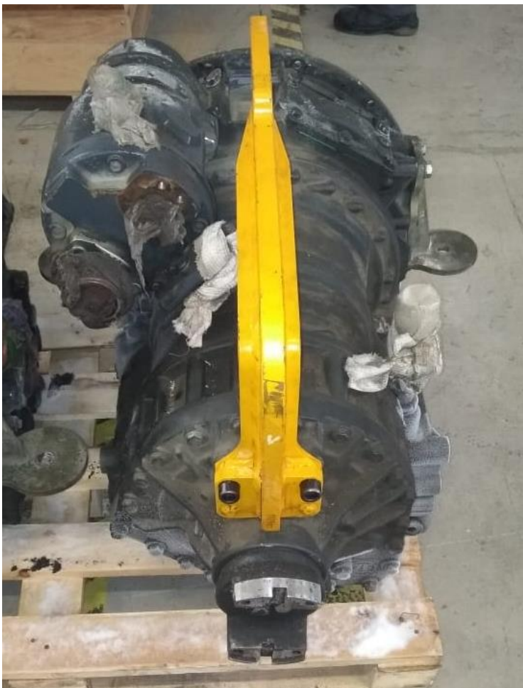
Рис. 3 Вид со стороны отбора мощности.