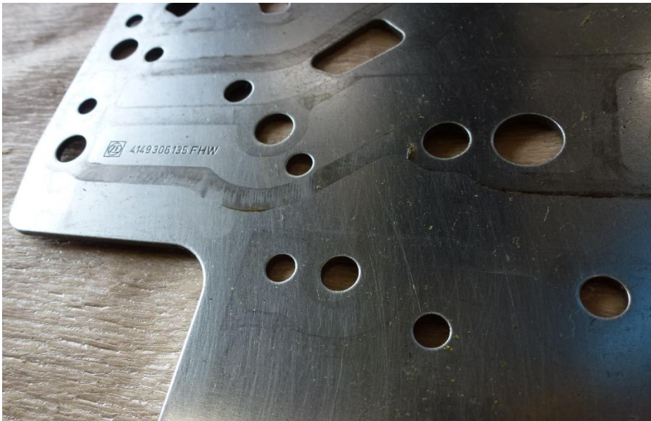
Рис. 15 Износ поверхности промежуточной плиты